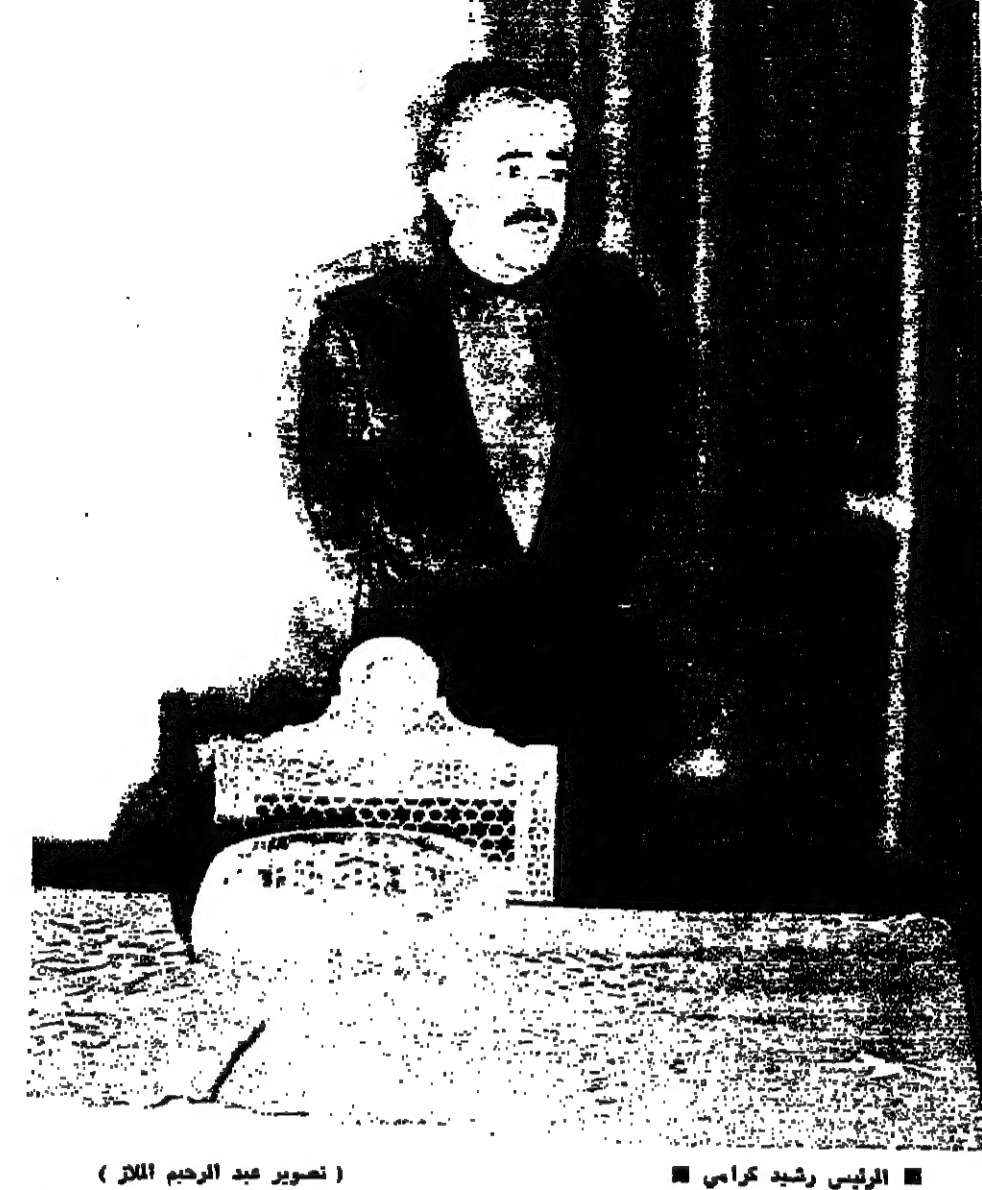
الرئيس رشيد كرايحي